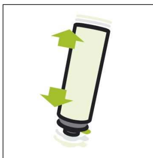
Ilustracja 1: Przynajmniej 20 razy silnie potrząsnąć puszką

Najnowszą wersję karty charakterystyki znajdują Państwo na stronie www.tremco-illbruck.com