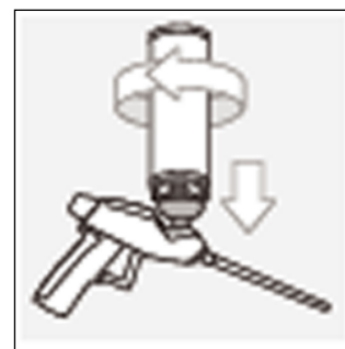
Ilustracja 2: Umieścić puszkę w gnieździe pistoletu i dokręcić do oporu.